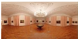
Muzeul Brukenthal 12 / 13