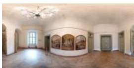
Muzeul Brukenthal 4 / 13