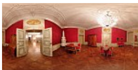
Muzeul Brukenthal 6 / 13