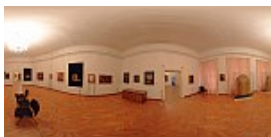
Muzeul Brukenthal 8 / 13