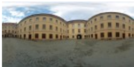
Muzeul Brukenthal 2 / 13