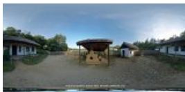
Gospodarie de pescari