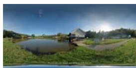
Lacul din Muzeu