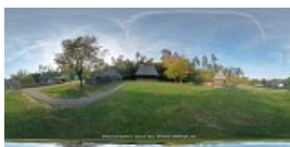
Biserica de lemn - Dretea