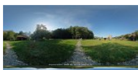
Mori de vant