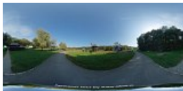
Moara de vant cu panze