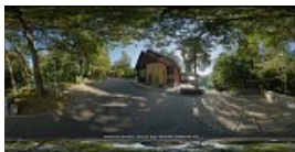
Intrare / Iesire din Muzeul Satului