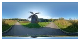
Moara de vant caciulata