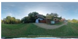
Atelier pentru prelucrarea canepii