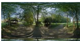
Alee spre Carciuma din Batrani