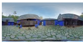
Gospodarie de oieri