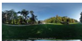
Carciuma din Batrani