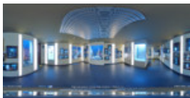
Muzeul de Istorie Naturala 1