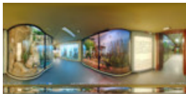
Muzeul de Istorie Naturala 3