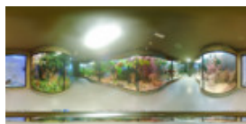
Muzeul de Istorie Naturala 4